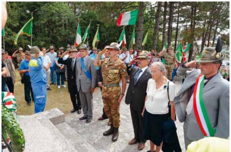
Onori ai Caduti

L'immane rancio alpino concludeva la giornata, favorita da un bel sole settembrino.