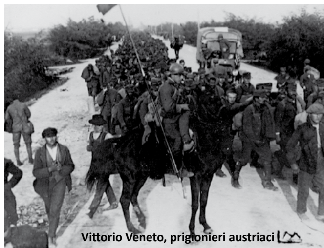
Vittorio Veneto, prigionieri austriaci

Il giorno 7 le avanguardie dei Reggimenti di cavalleria Saluzzo e Vicenza al comando del generale Favari di Fontana entrarono finalmente da vincitrici nella città.