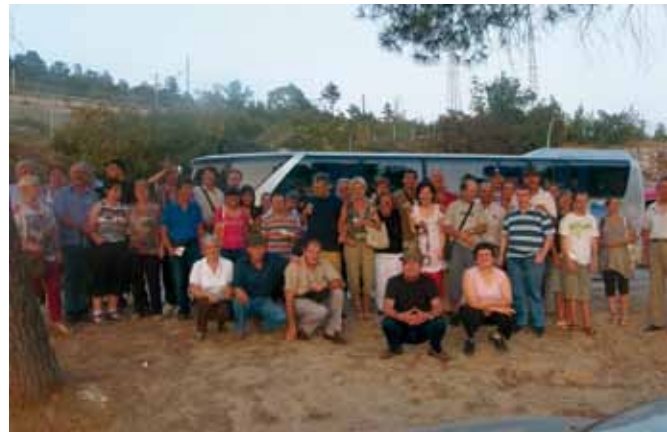
Foto del gruppo, con i ragazzi, genitori, accompagnatori e alpini.

La responsabile della gita ha ringraziato i Gruppi alpini per la solidarietà e partecipazione che da alcuni anni dimostrano nei confronti dei ragazzi di questa Associazione, con un sicuro arrivederci al prossimo anno.