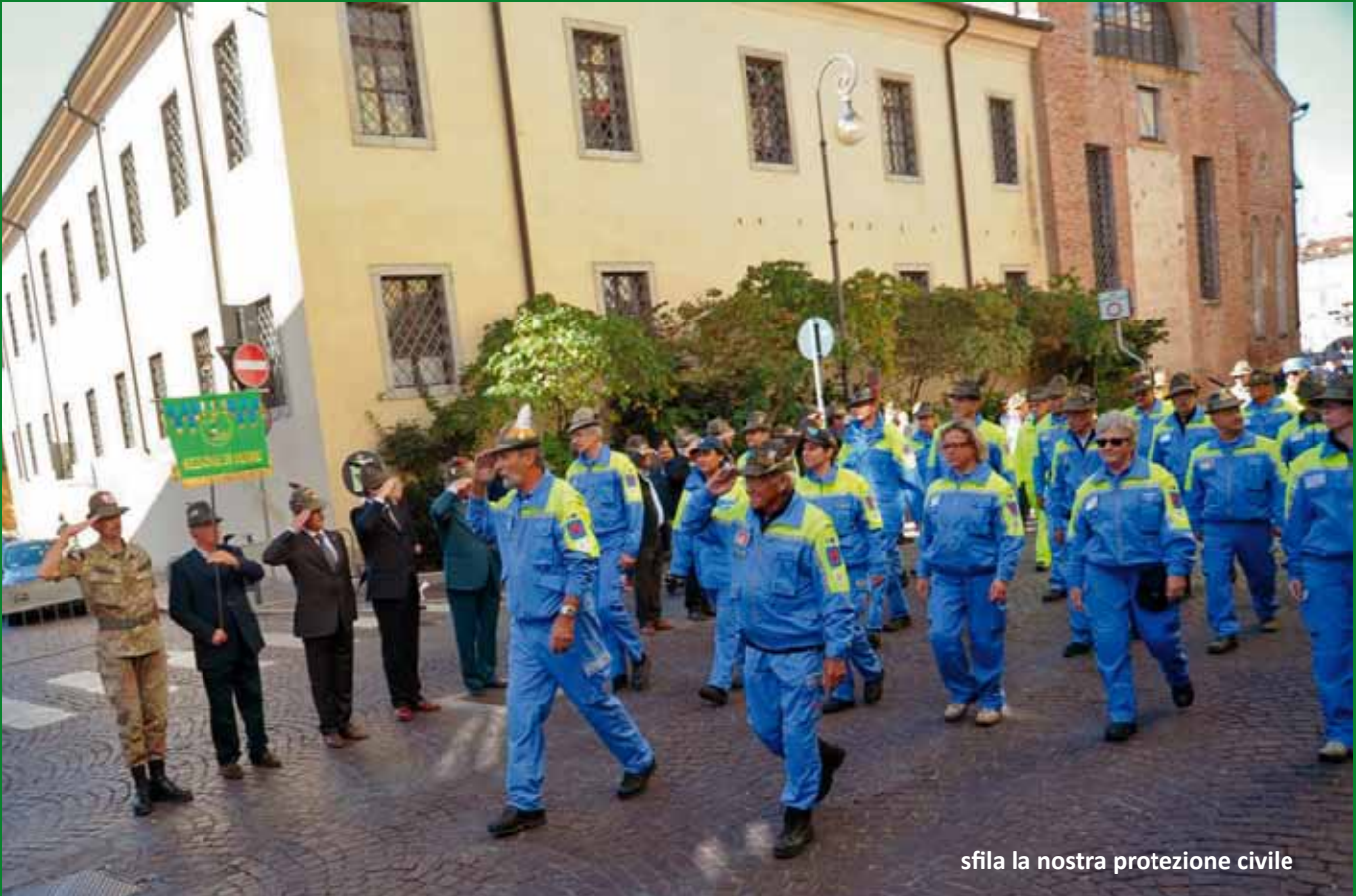
sfila la nostra protezione civile