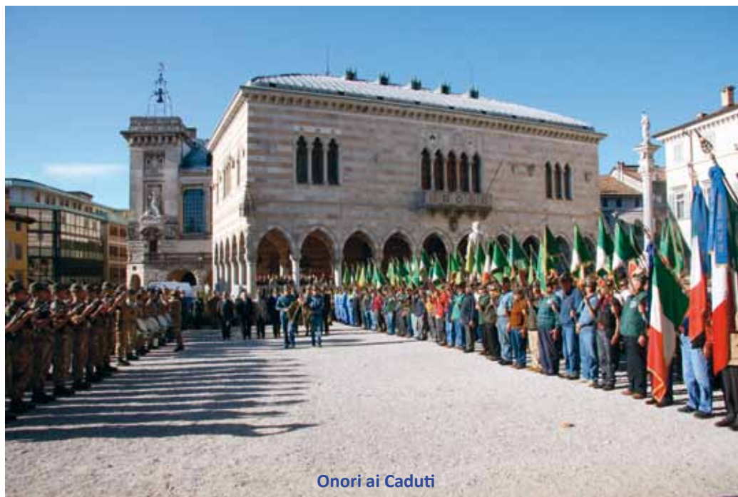
Onori ai Caduti

Agli ordini del Comandante la Compagnia i presenti si met-