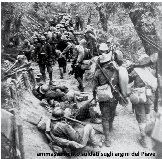
ammassamento soldati sugli argini del Piave

da tali operazioni, per motivi ritenuti “di affidabilità”, gli abitanti dei territori della bassa friulana e dell’isontino, che negli anni dal 1915 al 1916 passarono dalla giurisdizione asburgica a quella italiana, anche se ugualmente agenti italiani operarono in quelle zone fino alla conclusione delle ostilità.