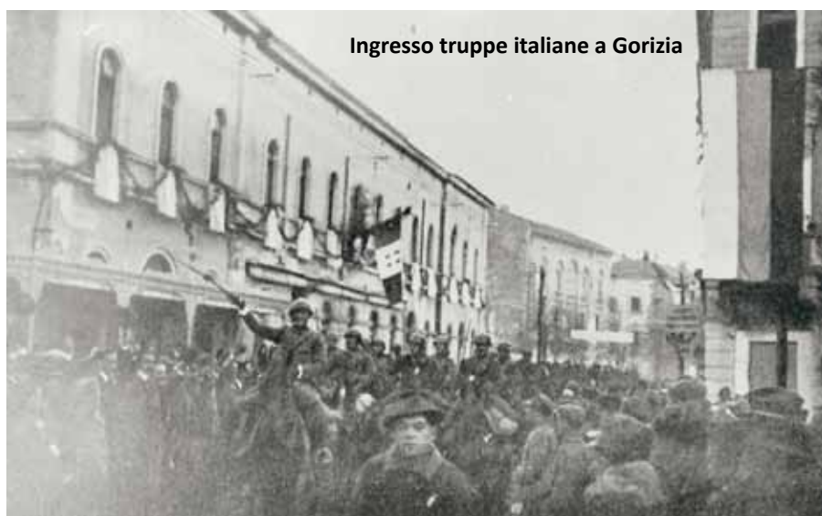
Ingresso truppe italiane a Gorizia

Se la parte della popolazione del Friuli occupato fu ritenuta idonea alla cooperazione, fu però d'obbligo escludere