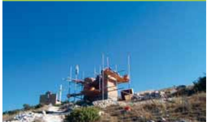
La cappella riprende forma