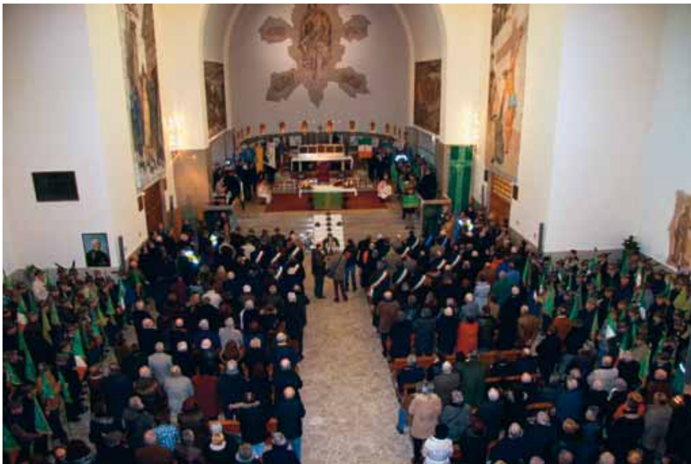
Uno scorcio dell'interno del Tempio di Carnaccio