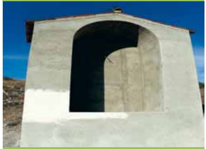
La cappella ricostruita