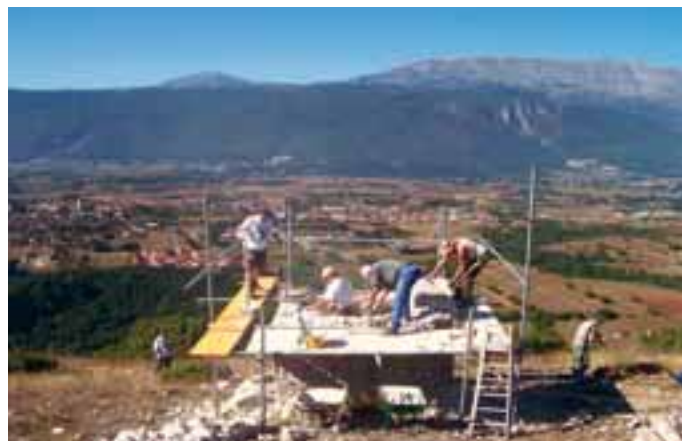
Lavori di demolizione