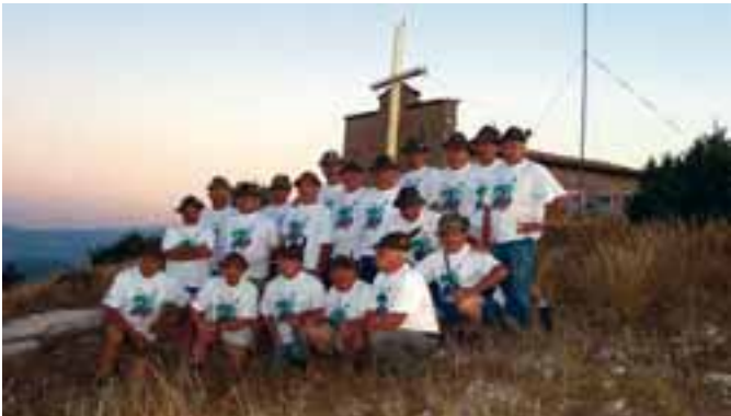
Il gruppo alle cinque di mattina

Consentitemi di fare alcuni doverosi ringraziamenti. All'Amministrazione Comunale nella persona del Sindaco Dott. Silvano Cappelli che ci ha supportato e garantito la parte logistica. Alla Protezione Civile Nazionale dell'ANA di Milano che ci ha aiutato nel disbrigo delle pratiche burocratiche. Al Dipartimento della Protezione Civile Nazionale che ha creduto in questo progetto con il riconoscimento di questa attività quale "esercitazione". In ultimo il ringraziamento a tutti i volontari, in partico-