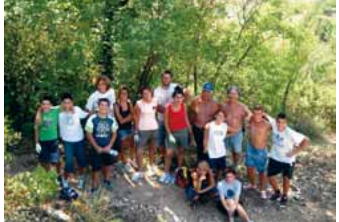
I ragazzi della Caritas di San Demetrio