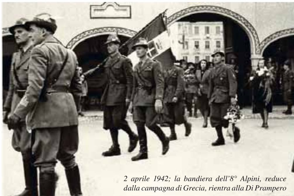
2 aprile 1942; la bandiera dell'8° Alpini, reduce dalla campagna di Grecia, rientra alla Di Prampero

Inviare il materiale all'indirizzo citato nel precedente articolo.