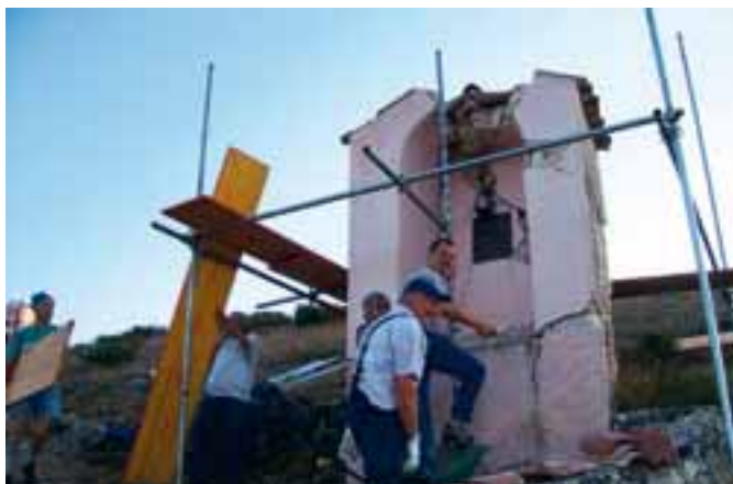
La cappella distrutta dal sisma

È stata un'altra bella esperienza ricca di soddisfazioni anche se impegnativa sul piano fisico. Nuove amicizie sono nate altre si sono consolidate.