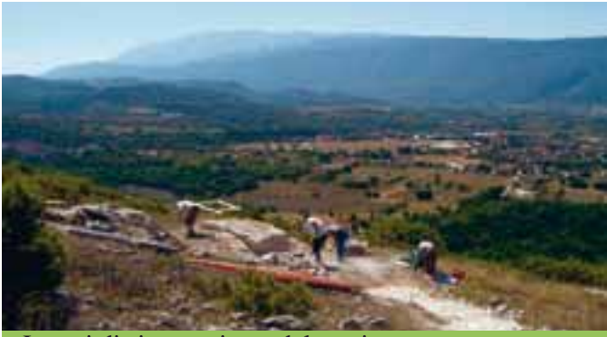
Lavori di sistemazione del sentiero

Consentitemi di fare alcuni doverosi ringraziamenti. All'Amministrazione Comunale nella persona del Sindaco Dott. Silvano Cappelli che ci ha supportato e garantito la parte logistica. Alla Protezione Civile Nazionale dell'ANA di Milano che ci ha aiutato nel disbrigo delle pratiche burocratiche. Al Dipartimento della Protezione Civile Nazionale che ha creduto in questo progetto con il riconoscimento di questa attività quale "esercitazione". In ultimo il ringraziamento a tutti i volontari, in partico-