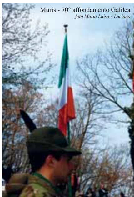
Muris - 70° affondamento Galilea

Stampa: Tipografia Moro Andrea - Tolmezzo