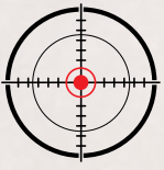
Progetto grafico QG Project per Grafismi