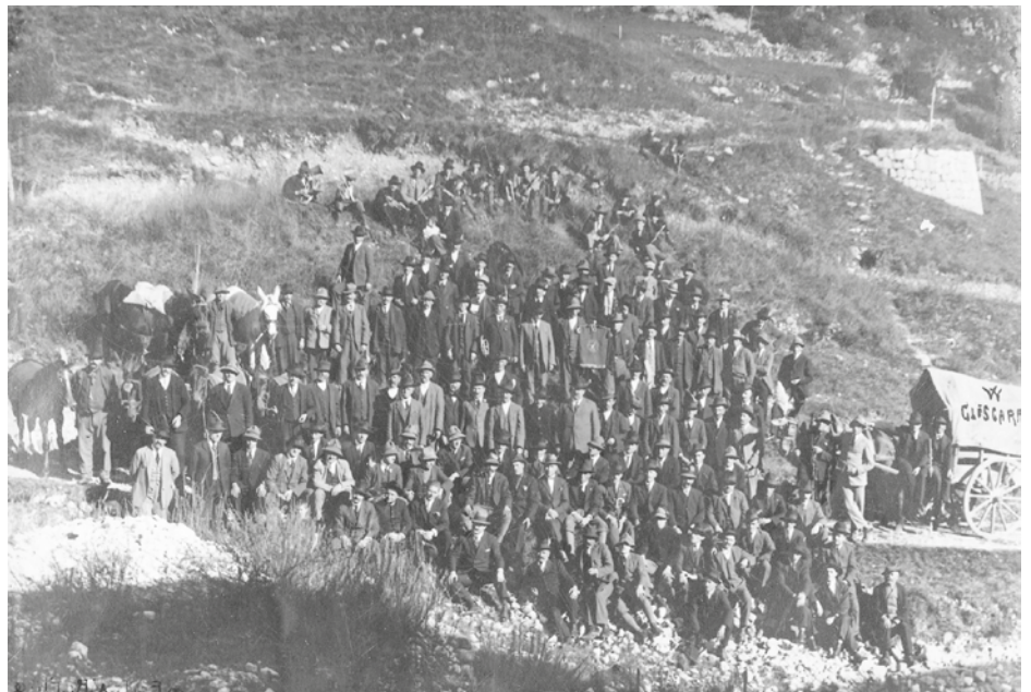
Gruppo Alpini di Arsiero, 20 ottobre 1924